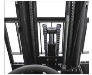
שדה ראייה פנוי כלפי מטה