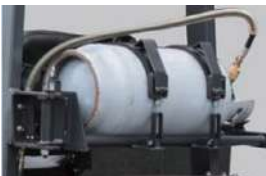
תושבת גפ"מ נפתחת החוצה