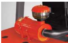
מנקה מוקדם ליניקת אוויר מנוע