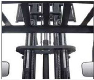
שדה ראייה פנוי כלפי מעלה