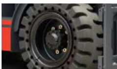
צמיגים מלאים אלסטיים במיוחד