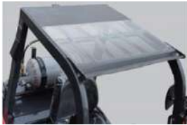
מגן גשם (סטנדרטי: אקרילי. אופציונלי: זכוכית)