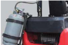
תושבת נפתחת כלפי מטה